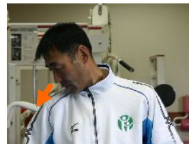
③鼻先を肩の方向に向けます。